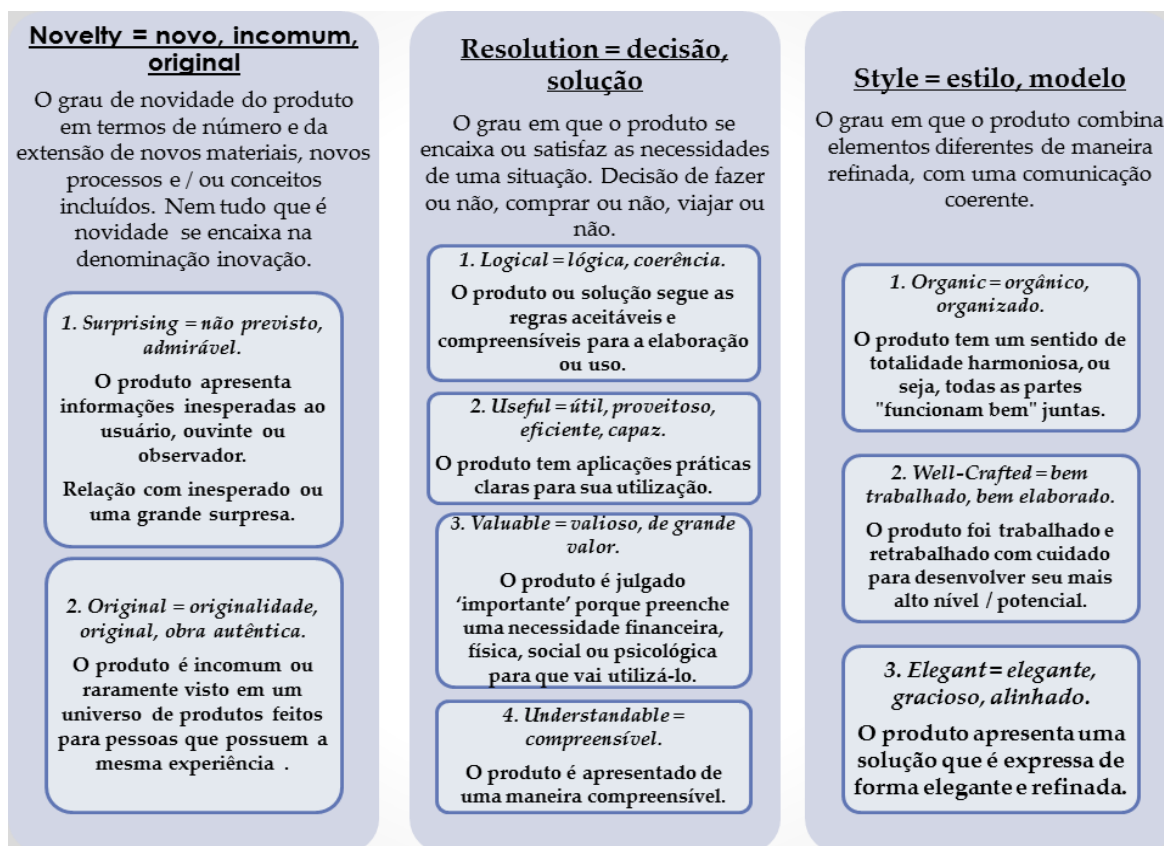
Figura 3: Matriz de análise de produtos criativos

Na criação de produtos, a figura 3, adaptada de Besemer (1998), sintetiza alguns processos importantes envolvidos na sua criação e análise e que para o presente contexto, conjuntamente com as dimensões da experiência, sintetizam um quadro de análise que foi aplicado no caso estudado.