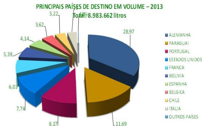
Figura 4: Principais países de destino da cachaça brasileira

A produção nacional divide-se em dois segmentos, a cachaça industrial e a cachaça de alambique ou artesanal. A cachaça industrial responde por cerca de 70% do mercado, enquanto a artesanal responde por 30%. Somente o Estado de Minas Gerais responde por uma participação de mercado de 50% do total da produção artesanal (COOCACHAÇA, 2007). No segmento industrial, São Paulo é o líder de mercado, com participação de 46% (ABRABE, 2007).