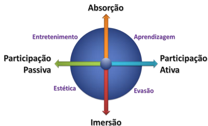
Figura 2: Dimensões da experiência

da perspectiva da Teoria do Fluxo e da perspectiva experiencial, pois o foco deixa de ser a materialidade de produtos e serviços para aspectos subjetivos, emocionais que visam ao encantamento e superação das expectativas dos clientes. Contudo, segundo Pine II e Gilmore (1999), a perspectiva experiencial é construída a partir de quatro fatores centrais, conforme apresenta a figura 2.